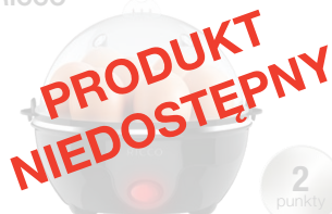
JAJOWAR ELEKTRYCZNY RICCO