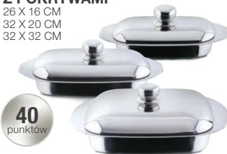
ZESTAW LASAGNER TRIS Z POKRYWAMI 26 X 16 CM 32 X 20 CM 32 X 32 CM