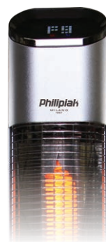
PIEC Z LAMPĄ WĘGLOWĄ PSG-15R