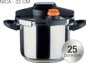
SZYBKOWAR POJEMNOŚĆ - 6 L ŚREDNICA - 22 CM