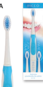
SZCZOTECZKA SONICZNA RICCO