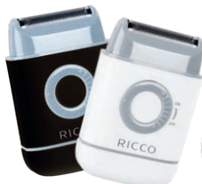
GOLARKA Z TRYMEREM RICCO BIAŁA LUB CZARNA