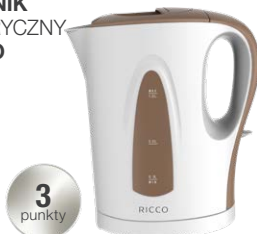
CZAJNIK ELEKTRYCZNY RICCO