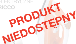
ŻELAZKO ELEKTRYCZNE RICCO