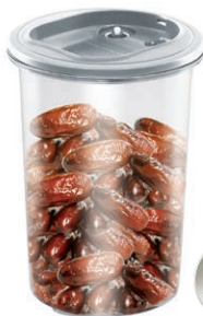
POJEMNIK PRÓŻNIOWY VACS 2 L