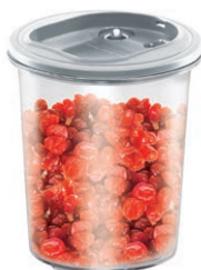
POJEMNIK PRÓŻNIOWY VACS 1,5 L