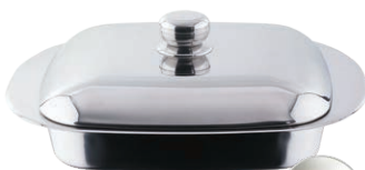
LASAGNERA DUŻA Z POKRYWĄ 32 X 32 CM