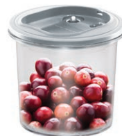
POJEMNIK PRÓŻNIOWY VACS 1 L