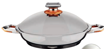
PATELNIĄ KRÓLEWSKA Z POKRYWĄ ŚREDNICA - 32 CM