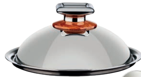
POKRYWA KULISTA DUŻA ŚREDNICA - 24 CM