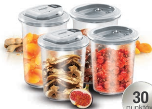
ZESTAW POJEMNIKÓW PRÓŻNIOWYCH VACS BIG