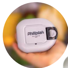
POMPKA ELEKTRYCZNA VACS