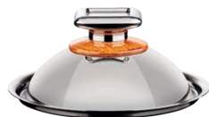
POKRYWA KULISTA ŚREDNIA ŚREDNICA - 20 CM