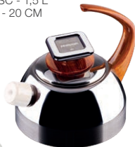
CZAJNIK Z POKRYWĄ (BEZ GWIŹDKA) POJEMNOŚĆ - 1,5 L ŚREDNICA - 20 CM