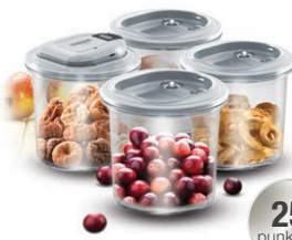
ZESTAW POJEMNIKÓW PRÓŻNIOWYCH VACS SMART