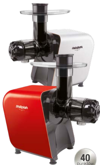
WYCISKARKA WOLNOOBROTOWA SREBRNA LUB CZERWONA