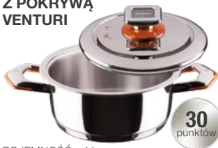
NACZYNIOPATELNIĄ Z POKRYWĄ VENTURI