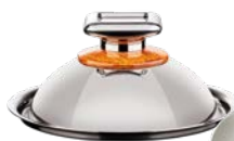
POKRYWA KULISTA ŚREDNIA ŚREDNICA - 20 CM