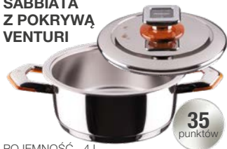
NACZYNIOPATELNIĄ SABBIATA Z POKRYWĄ VENTURI