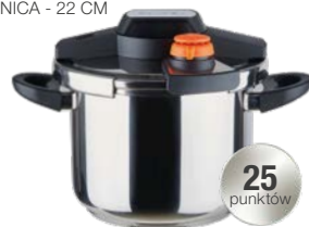
SZYBKOWAR POJEMNOŚĆ - 6 L ŚREDNICA - 22 CM