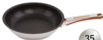
PATELNIĄ DIAMOND DUŻĄ ŚREDNICA - 24 CM