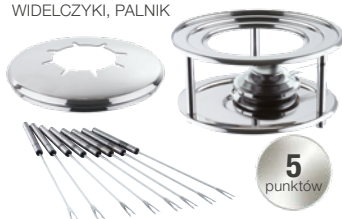
ZESTAW FONDUE PODSTAWKA, POKRYWA WIDELCZYKI, PALNIK