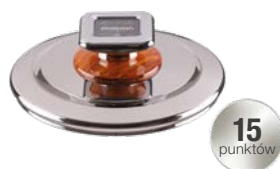
POKRYWA MAŁA VENTURI ŚREDNICA - 20 CM