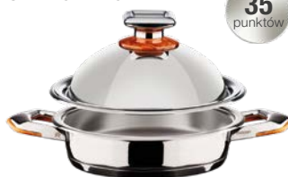
PATELNIĄ SABBIATA Z POKRYWĄ KULISTĄ ŚREDNICA - 24 CM