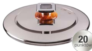
POKRYWA DUŻA VENTURI ŚREDNICA - 32 CM