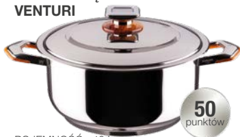
TURBO-PIEKARNIK BOMBATINA Z POKRYWĄ VENTURI