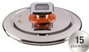
POKRYWA ŚREDNIA VENTURI ŚREDNICA - 24 CM