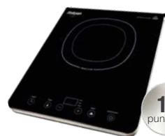
KUCHENKA INDUKCYJNA 1 POLE GRZEWCZE