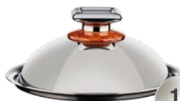
POKRYWA KULISTA DUŻA ŚREDNICA - 24 CM